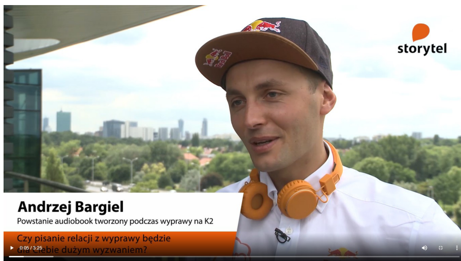
Grafika 7. Kadr z filmu promującego projekt „Atak na K2” Źródło: Atak2... , dz.cyt. (dostęp 11.09.2021 r.).