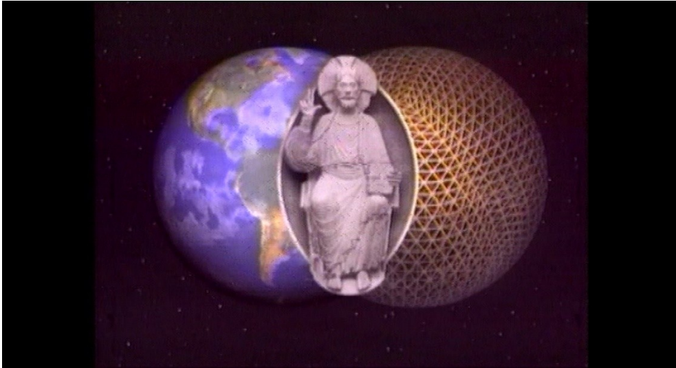
Rys. 1: Screen z czołówki cyklu „Depozyt Wiary”